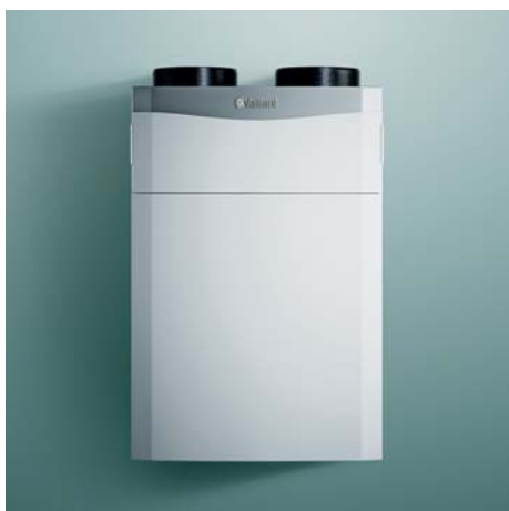
recoVAIR VAR 260/4 a 360/4