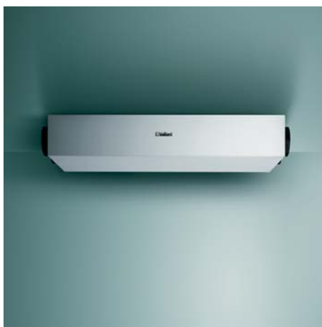
recoVAIR VAR 150/4