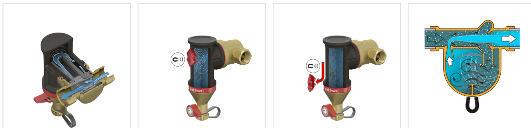
Selection table for Flamcovent & Clean Smart series