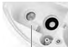
Antibakteriální stříbrná kostka